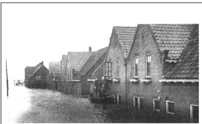
De huizen aan de Nijverheidsstraat te Krimpen tijdens de watersnood. >>>